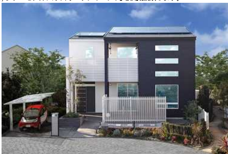
アイフルホーム金沢北店 割出展示場の『Newセシボ』モデルハウス外観イメージCGです。

住宅のフランチャイズチェーン(以下「FC」と表記)を全国に展開している株式会社LIXIL住宅研究所アイフルホームカンパニー(住所:東京都江東区亀戸1-5-7/TEL03-5626-8251/プレジデント:勝又 健一郎)のFC加盟店である、アイフルホーム金沢北店(会社:株式会社エスアイユー常陽)では、キッズデザインの考え方をベースに開発され、4月より全国で販売を開始した新商品『家族の絆と夢を育む家「Newセシボ」』のモデルハウスを金沢市内に完成させ、6月16日(土)より「モデルハウスオープンイベント」を開催致します。