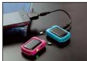
(ソーラー式携帯充電器)

ご来場いただいた方へ、先着10名様に各キャリアに対応した『ソーラー式携帯充電器』をプレゼント致します。さらに、ご希望の方にはアイフルホームで家を建てられた方々の実例をご紹介している『こだわりのmyプラン100』カタログを差し上げます。