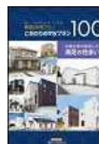
(こだわりのmyプラン100)

本件に関する報道関係者様からのお問い合わせは下記までお願いします。 (株)LIXIL住宅研究所 広報・宣伝部 アイフルホーム広報担当 千明(ちぎら)