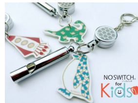
ミニホイッスルキーホルダー

※本件に関する報道関係者様からのお問い合わせは下記までお願いします。 株式会社LIXIL住宅研究所 広報・宣伝部 アイフルホーム広報担当 千明(ちぎら)・上田 電話：03-5626-8251 アイフルホームホームページ/TOP URL： http://www.eyefulhome.jp/ 商品ラインナップ URL： http://www.eyefulhome.jp/lineup/ アイフルホーム小松店 URL： http://www.all-eyefulhomenavi.com/ida/komatsu/