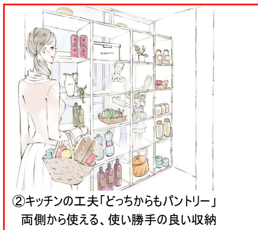
②キッチンの工夫「どっちからもパントリー」 両側から使える、使い勝手の良い収納