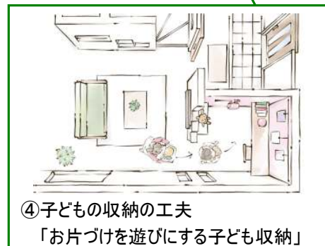
④子どもの収納の工夫 「お片づけを遊びにする子ども収納」

その他、洗う、干す、たたむ、しまうといった作業をラクにこなせる「脱衣室収納」や両サイドに入口を設け、2ヶ所から通り抜け出来る「ウォークインクローゼット」、たまにしか使わない季節家電や思い出の品等をしまうため、小屋裏の空いているスペースを使った「小屋裏収納」などの工夫で家族みんなで収納上手になる家をご提案しています。