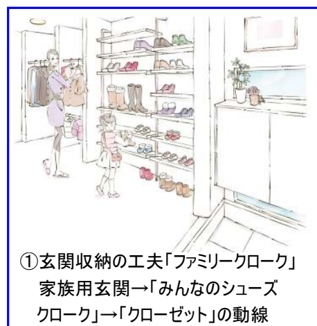
①玄関収納の工夫「ファミリークローク」 家族用玄関→「みんなのシューズクローク」→「クローゼット」の動線

キッチンでのポイントは、動線をスムーズに、しまいやすく・使いやすいく便利な収納であること。パントリーをキッチン裏に配置し、パントリーとキッチンとの間にどちらからも使える「どっちからもパントリー」をご提案。キッチン側からも取り出せるので料理をするときに便利な収納となっています。さらに、キッチン周りの収納や冷蔵庫などがリビングから見えないように配置し、急な来客でも散らかっているのが見えない「すっきりキッチン」をご提案しています。