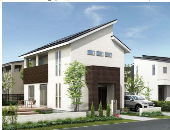
《「家族で収納上手な家」外観イメージ》

尚、これにあわせて『収納ラクラクフェア』を全国のアイフルホーム加盟店にて10月6日より開催致します。