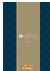
「セシボ コンセプトブック」