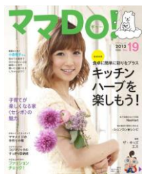
子育て情報誌 「ママDO！19号」

フェア期間：2013年4月27日(土)～4月29日(月) 新モデルハウス体感フェアにご来場され、アンケートにご記入いただいた方全員に、子育てママに役立つ情報誌「ママDO！19号」と、セシボについて紹介している最新のカタログを差し上げます。さらに、先着10組様限定で、クオカード1000円分を差し上げます。