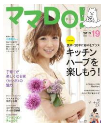
子育て情報誌 「ママDO! 19号」

フェア期間：2013年4月27日(土)～4月29日(月) 新モデルハウス体感フェアにご来場され、アンケートにご記入いただいた方全員に、子育てママに役立つ情報誌「ママDO! 19号」と、セシボについて紹介している最新のカタログを差し上げます。さらに、先着10組様限定で、クオカード1000円分を差し上げます。