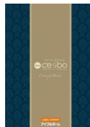
「セシボ コンセプトブック」