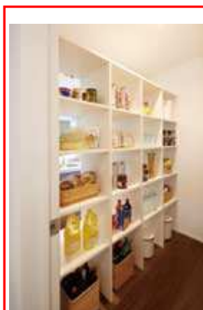
②キッチンの工夫「どちらからもパントリー」両側から使える、使い勝手の良い収納