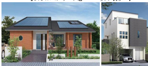
<(左)平屋建て「NewAYA」、(右)3階建て「Newスプリーム」外観イメージ>

【販売目標】初年度契約目標 『Newセシボ』 3,200棟/年 『NewAYA』 300棟/年 『Newスプリーム』 100棟/年