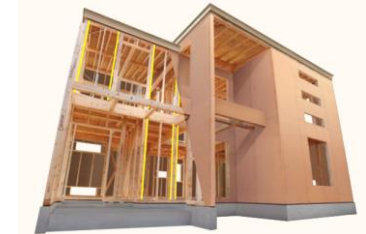
写真1:制震システム「EVAS」