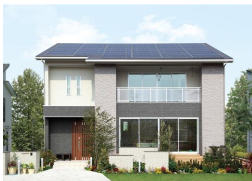
＜2階建て「Newセシボ」外観イメージ＞

アイフルホームでは、キッズデザインをコンセプトに、家族みんなの“絆”を深め、家族一人ひとりの“夢”をかなえる「生涯にわたって幸せな暮らしを“ずっと”続けていける住まい」を今後ご提案していきます。