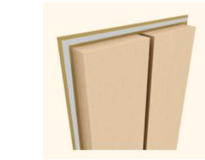
写真2:高性能断熱パネル「HQP」(ハイクオリティパネル)イメージ

内と外をつなぐ開口部を通常よりも大きくすることが可能。光と風を充分に取り込むことができ、快適性+パッシブエコで心地いい暮らしを実現します。