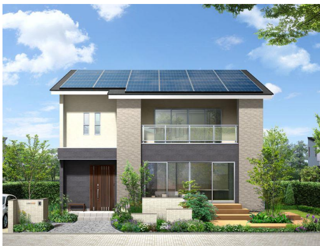
アイフルホーム姫路店「Newセシボ」 新モデルハウス外観イメージ

今回のモデルハウスは、アイフルホームが開発した新技術“高耐力コア(特許出願済)”により大空間・大開口を実現しながら、耐震性、高气密・高断熱仕様による快適性と省エネ性、将来のライフステージの変化に対応した間取りの可変性を確保しており、住まう際のランニングコストの削減に優れた商品となっています。