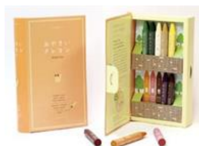
〈来場者プレゼント〉おやさいクレヨン