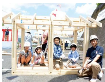
〈来場者イベント〉ちびっこ棟梁

お子様向けには、「はずれくじなし!くじ引きで当たる『妖怪ウォッチお楽しみ抽選会』」を開催します。1等にはアイフルホームでしか手に入らない「アイフルホームオリジナル妖怪ウォッチユニットラグ」を用意しています。