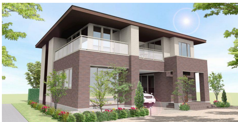
アイフルホーム仙台中央店 仙台駅東口展示場 「セシボEX-H」新モデルハウス外観イメージ