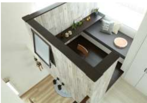
(左) 段差のあるスキップ空間提案イメージ、(右) ツリーハウスのような書斎提案イメージ