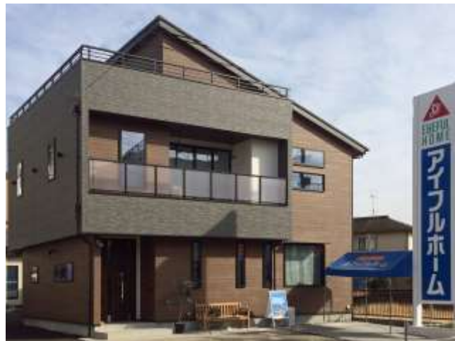
アイフルホーム浦和店「セシボ」外観

開放的で家族が思わず集まりたくなる大空間リビング、買ってきた食材をすぐにしまえて便利な大容量パントリー、家族用とお客様用を分けることで、来客時にはすっきりと片付いた状態でお出迎えられる玄関、趣味や収納に大活躍の広々ロフト、さらには、開放感がうれしい屋上バルコニーなど、家族が楽しく、快適に過ごせる住まいのアイデア満載のモデルハウスです。