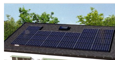
写真1:太陽光発電システム

・CO2 の発生がない新エネルギー技術の太陽光発電システムで昼間の生活に必要な電気を創る(右写真1参照)