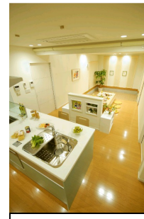
▲オープンキッチン