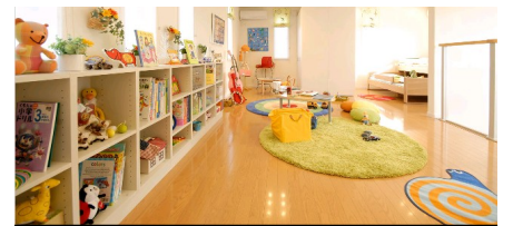
▲どこでも辞書・思い出ステーション