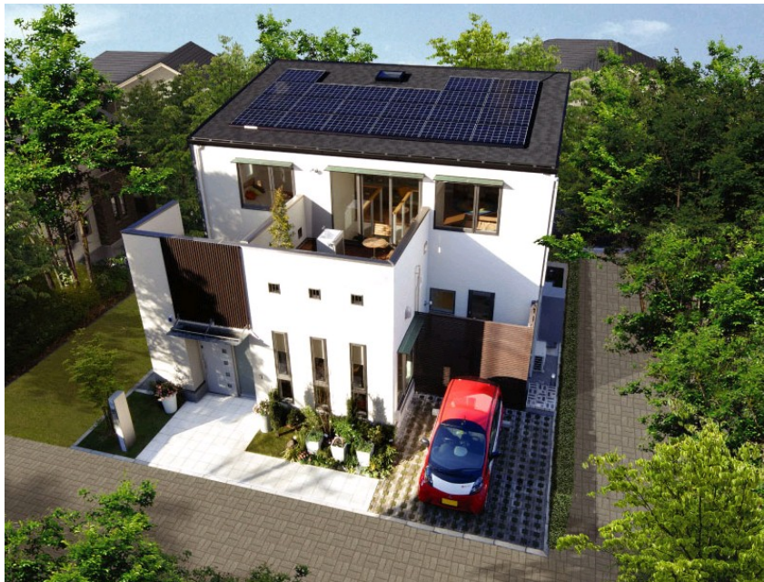
≪新商品『セシボ・アニバーサリー』外観写真≫

※添付の写真は、41坪コンセプトプラン(41CAS-9095プラン)の新商品外観イメージCGです。