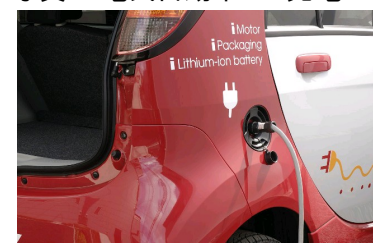
写真2:電気自動車への充電

・電気自動車専用のタイマー付き充電コンセントを採用することで、選択的に安価でCO2 発生が少ない深夜電力からの充電が可能