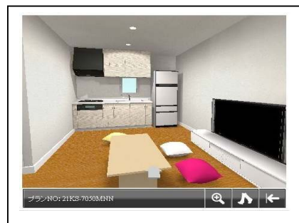
《3Dバーチャル展示場イメージ》