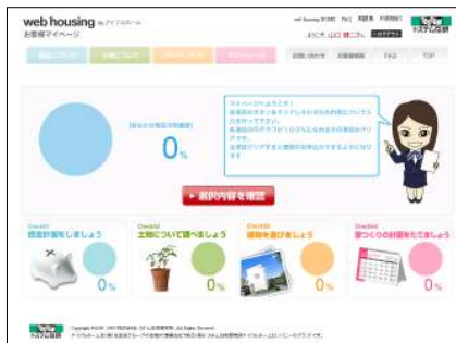
《会員登録後のページ》