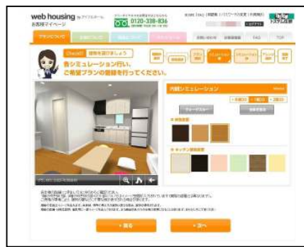
《3Dバーチャル展示場のページ》