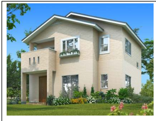
《セシボ ハッピーママ～収納上手な家～外観イメージ》