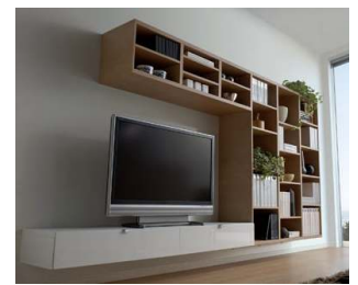
写真2:「リビング収納」