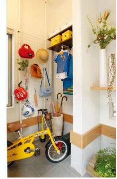
写真1:「玄関土間収納」