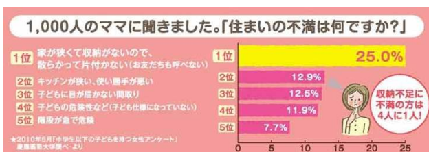
《1,000人のママのアンケート『住まいの不満について』》

アイフルホーム女性開発チームが中心となり“女性の目線”、“建築のプロの目線”で商品開発を行い、ママの期待に応えられる内容となっております。尚、これにあわせて、『収納上手な家見学会』を全国のアイフルホーム加盟店にて11月6日より開催致します。