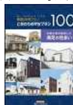
(こだわりのmyプラン100)

本件に関する報道関係者様からのお問い合わせは下記までお願いします。 (株)LIXIL住宅研究所 広報・宣伝部 アイフルホーム広報担当 千明(ちぎら) 電話:03-5626-8251