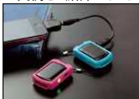
(ソーラー式携帯充電器)

ご来場いただいた方へ、各キャリアに対応した『ソーラー式携帯充電器』や、アイフルホームで家を建てられた方々の実例をご紹介している『こだわりのmyプラン100』カタログを差し上げます。