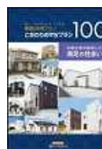
(こだわりのmyプラン100)

本件に関する報道関係者様からのお問い合わせは下記までお願いします。 (株)LIXIL住宅研究所 広報・宣伝部 アイフルホーム広報担当 千明(ちぎら)