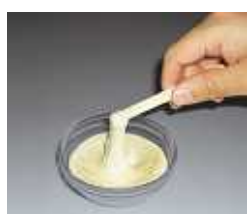
高層ビルの制震装置に 用いられる粘弾性体