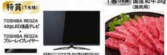
(参考)大抽選会景品)