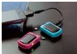
(来場者プレゼント:ソーラー式携帯充電器)

同時に、抽選で「大型液晶テレビ+ブルーレイプレイヤー」、「国産和牛3kg」など、豪華景品が当たる大抽選会を開催致します。