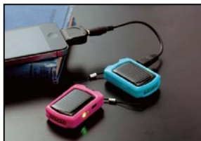
《ソーラー式携帯充電器》