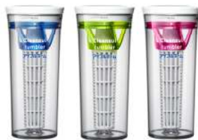
《浄水器タンブラー》

チラシを持参いただき、ご来場者アンケートへご記入頂いた方へ、先着10名様にどこでも水道水がミネラルウォーターに変わる!『クリンスイ 浄水器タンブラー』をプレゼント致します。さらに、ご希望の方にはアイフルホームで家を建てられた方々の実例をご紹介している『こだわりのmyプラン100』カタログを差し上げます。