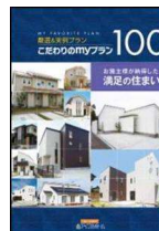
《こだわりのmyプラン100》