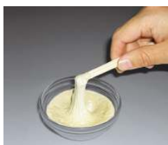
高層ビルの制震装置に 用いられる粘弾性体