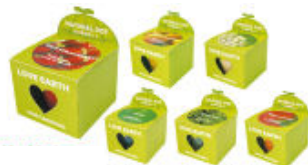
ナチュラル栽培ポット イメージ

ご来場いただいた方全員に、観葉植物を育てる「ナチュラル栽培ポット」を差し上げます。 また、アンケートにご記入いただいた方は、レジャーグッズが当たる抽選会に参加していただくことができます。お子さまには、お菓子のすくい取りもご用意しております。 また、モデルハウスオープンを記念して、9/15～10/31までにご成約いただいた方には、シャープ太陽光発電システム3.06kwをプレゼントするキャンペーンを実施いたします。(※先着10名様)