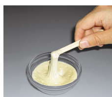
高層ビルの制震装置 に用いられる粘弾性体