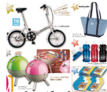
レジャーグッズ イメージ

※本件に関する報道関係者様からのお問い合わせは下記までお願いします。 (株)LIXIL住宅研究所 広報・宣伝部 アイフルホーム広報担当 千明(ちぎら)・上田 電話:03-5626-8251 アイフルホームホームページ/TOP URL: http://www.eyefulhome.jp/ 商品ラインナップ URL: http://www.eyefulhome.jp/lineup/