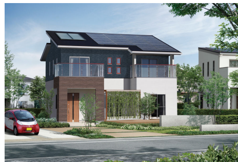
セシポ スマートハウス(コンテンポラリースタイル)