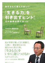
『「生きる力」を引き出すヒント!』 (※先着10組様)

※本件に関する報道関係者様からのお問い合わせは下記までお願いします。 (株)LIXIL住宅研究所 広報・宣伝部 アイフルホーム広報担当 千明(ちぎら)・上田 電話:03-5626-8251