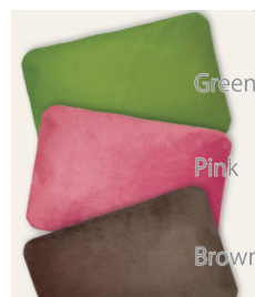
「エネタンポ」(※先着10組様)

モデルハウスオープンイベントにご来場された先着10組様限定に、充電式湯たんぽの「エネタンポ」を差し上げます。約15分の充電で蓄熱し、その後は約6時間暖かさを保ちます。何度でも繰り返し使えて、これからの季節にうれしい湯たんぽです。