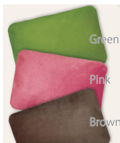
「エネタンポ」(※先着10組様限定)

※本件に関する報道関係者様からのお問い合わせは下記までお願いします。 株LIXIL住宅研究所 広報・宣伝部 アイフルホーム広報担当 千明(ちぎら)・上田 電話:03-5626-8251