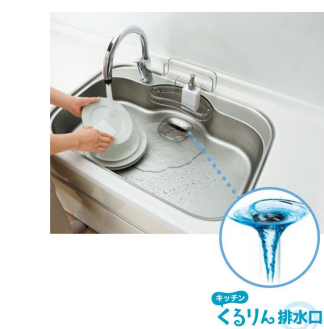
写真4:清掃しやすいシンク