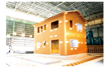
写真2:耐震+制震構造