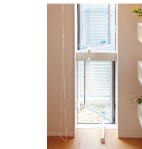
写真3:ウインドキャッチャー