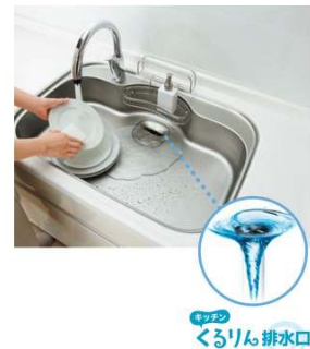
写真4:清掃しやすいシンク