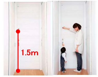
写真1:チャイルドロック