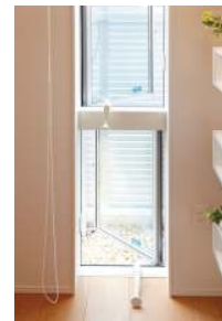
写真3:ウインドキャッチャー