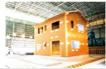
写真2:耐震+制震構造