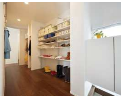
①玄関収納の工夫「ファミリークローク」家族用玄関→「みんなのシューズクローク」→「クローゼット」の動線

キッチンでのポイントは、動線をスムーズに、しまいやすく・使いやすい便利な収納であること。パントリーをキッチン裏に配置し、パントリーとキッチンとの間にどちらからも使える「どっちからもパントリー」をご提案。キッチン側からも取り出せるので料理をするときに便利な収納となっています。さらに、キッチン周りの収納や冷蔵庫などがリビングから見えないように配置し、急な来客でも散らかっているのが見えない「すっきりキッチン」をご提案しています。