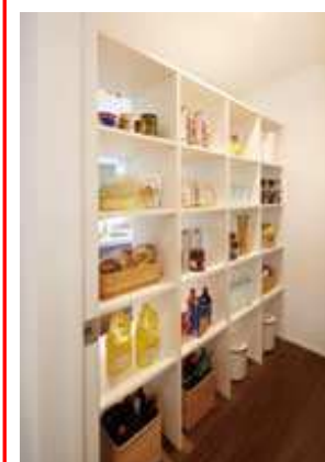
②キッチンの工夫「どっちからもパントリー」両側から使える使い勝手の良い収納