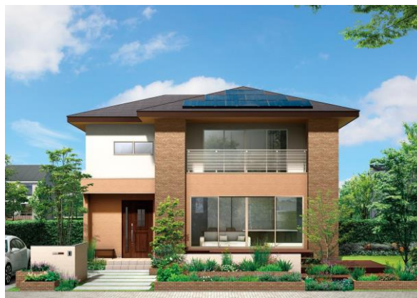
アイフルホーム大分東店 下郡展示場 「Newセシボ」新モデルハウス外観イメージ

今回のモデルハウスは、アイフルホームが開発した新技術“高耐力コア(特許出願済)”により大空間・大開口を実現しながら、耐震性、高気密・高断熱仕様による快適性と省エネ性、将来のライフステージの変化に対応した間取りの可変性を確保しており、住まう際のランニングコストの削減に優れた商品となっています。