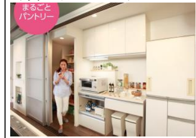
写真1:まるごとパントリー

② しまえる、使える、隠せる自由自在のパントリー すぐ使うモノも買い置き的大型食材もすべて収納でき、しかも冷蔵庫などの家電や食器棚も全部隠せるので急な来客にも安心です。(写真1)