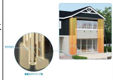
イメージ1:高耐久コア

② しまえる、使える、隠せる自由自在のパントリー すぐ使うモノも買い置き的大型食材もすべて収納でき、しかも冷蔵庫などの家電や食器棚も全部隠せるので急な来客にも安心です。(写真1)