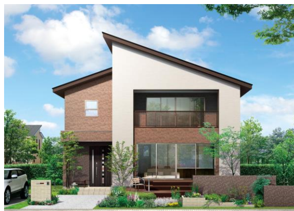
アイフルホーム鹿児島店「セシボ」 新モデルハウス外観イメージ

今回のモデルハウスは、アイフルホームが開発した新技術“高耐力コア(特許出願済)”により大空間・大開口を実現しながら、耐震性、高气密・高断熱仕様による快適性と省エネ性、将来のライフステージの変化に対応した間取りの可変性を確保しており、住まう際のランニングコストの削減に優れた商品となっています。