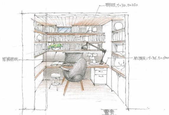
「書斎スペース」イメージパース

イベント情報：新モデルハウスオープンを記念して、4週末連続で、各週先着10組様にご来場者プレゼントをご用意しています。