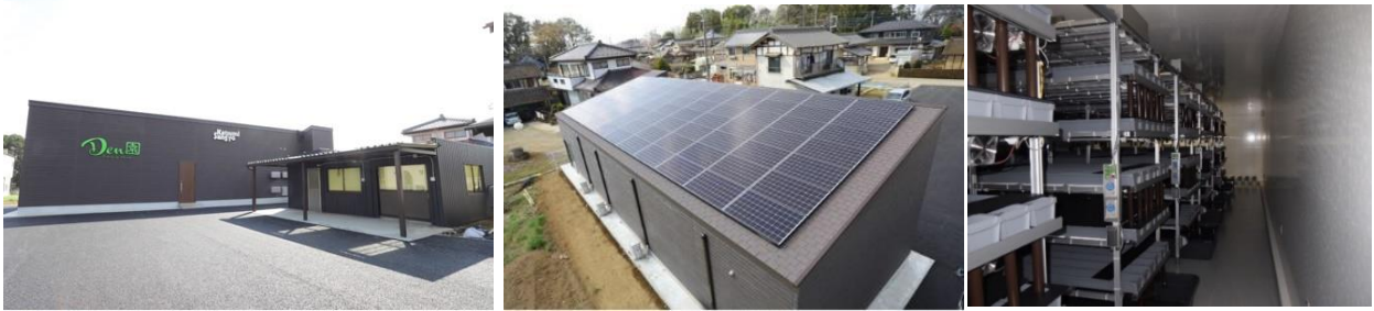
茨城県結城郡に完成した水耕栽培プラントの外観と内観

住宅フランチャイズチェーンを全国展開する株式会社LIXIL住宅研究所は、株式会社クリーンファームと協働し、低コストで建設可能な人工光型植物工場※「水耕栽培プラント」の取り扱いを全国で本格的に開始します。これに伴い、第一弾として、農業法人株式会社Future farm Den園が施主となり、宇都宮アイフルホーム株式会社が建設した水耕栽培プラントが3月4日に茨城県結城郡にて竣工しました。