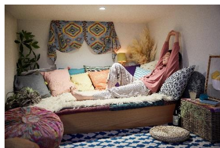
『FAVO for RELAX #心地よい時間を過ごす』イメージ

新型コロナウイルス感染拡大が広がる中、新しい生活様式の徹底が求められ、自宅で過ごす時間が増えてきます。自宅を出ることが少なくなり運動量が減っている、一人になれる場所・時間がないなど、お客様の暮らしはこれまでと大きく変化してきています。アイフルホームでは、2020年9月にコロナ禍における住まいのニーズについてアンケートを実施しました。その結果、「趣味や家事を楽しむリラックス空間がほしい」「暮らしの中にグリーン(植物)を取り入れたい」とのニーズがあることがわかりました。