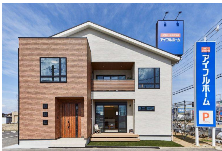
アイフルホーム神栖店新モデルハウス「FAVO for RELAX」外観