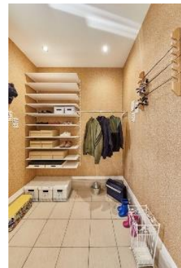
アイフルホーム神栖店 新モデルハウス内観 (左上)カウンターキッチン、(右上)リビング階段に設けられた壁一面のディスプレイ収納 (左下)テレワークスペース、(中下)ソックススペース、(右下)土間収納