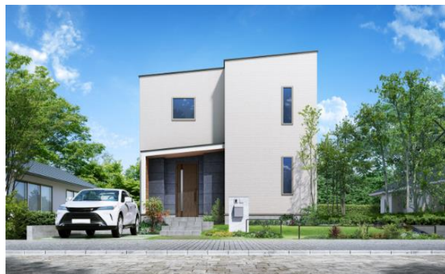
「Lodina」外観イメージ(スタイリッシュモダン) 平屋(左) / 2階建て(右)