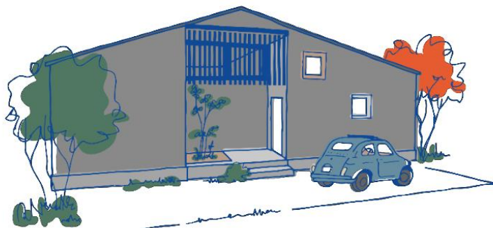
『FAVO for HIRAYA-Re:Discovery Your Life-』外観イメージ

株式会社LIXIL住宅研究所アイフルホームカンパニーは、主力商品『FAVO(フェイボ)』で提案する平屋において、家族の笑顔、食事の香り、降りそそぐ光と風といった何気ない日常の暮らしに愛着を感じられる暮らしを実現する「愛おしい日常」をコンセプトとした新提案『FAVO for HIRAYA -Re:Discovery Your Life-』を2023年1月21日(土)から発売します。